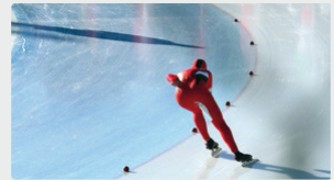
Eislaufbahnen bleiben länger glatt