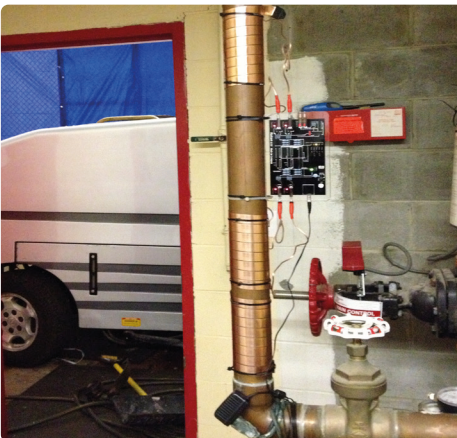
Vulcan S25 Installation in der Ice Land Eishockey Halle