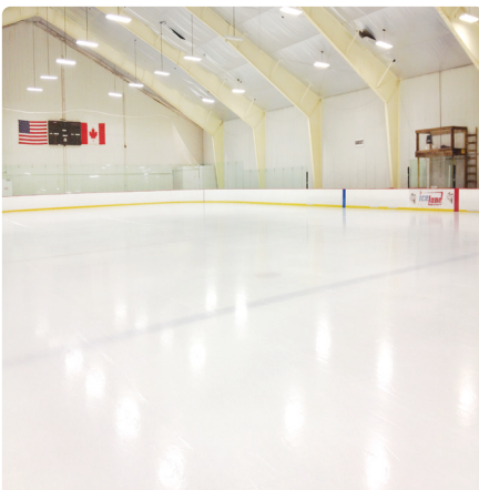
Eishalle mit neu auftragener Eisschicht