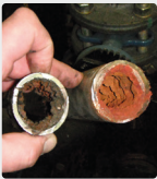
Rohrleitungen aus einem Maschinenraum