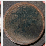
Kalk mit Biofilm im Rohr