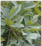
Pflanzen und Rasen