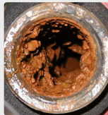
Kalk mit Biofilm im Rohr