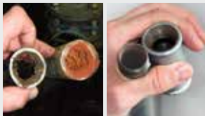
Sistema de tuberías