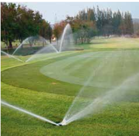
Sistema de aspersores en un campo de golf