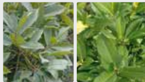
Plantas de invernadero