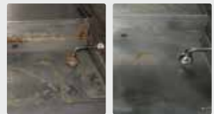
Parrilla de una cocina profesional