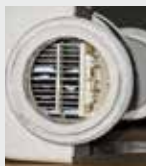
Filtro para piscina