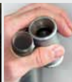
Sistema de tuberías